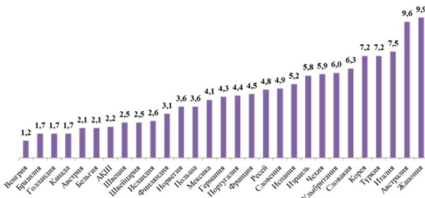
Борыштың Үлкен жиырмалық (G20) елдеріндегі қаржы ұйымдарының меншікті капиталына қатынасы

Осылайша, Оператордың бастапқы капиталының мөлшерін айқындау кезінде борыштың меншікті капиталға оңтайлы арақатысы (debt-to-equity ratio) ретінде 1-ге 5 мәні алынды. Осыған орай, Оператор борышының ең көп көлемі облигациялар түрінде 1 трлн теңге мөлшерінде болған кезде Оператордың бастапқы құрауышты (қаржылық орнықтылықты) өтеуге арналған жарғылық капиталы кемінде 200 млрд теңгені құрауға тиіс. Сонымен қоса, Оператордың жарғылық капиталы күн сайынғы операциялық шығасыларды өтеуге арналған қаражатты қамтуы тиіс.