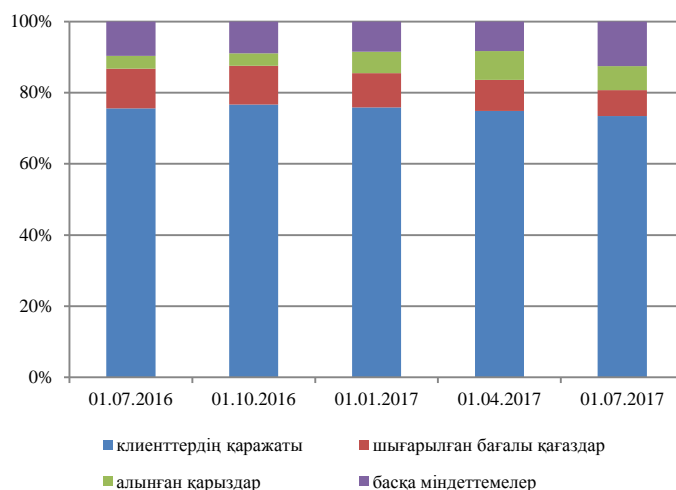
4-график. Банк конгломераттары міндеттемелерінің динамикадағы құрылымы

Банк конгломераттарының меншікті капиталы бір тоқсанда 467,0 млрд. теңгеге (немесе 24,5%-ға) азайды және есепті күнге 1 438,3 млрд. теңгені құрады.