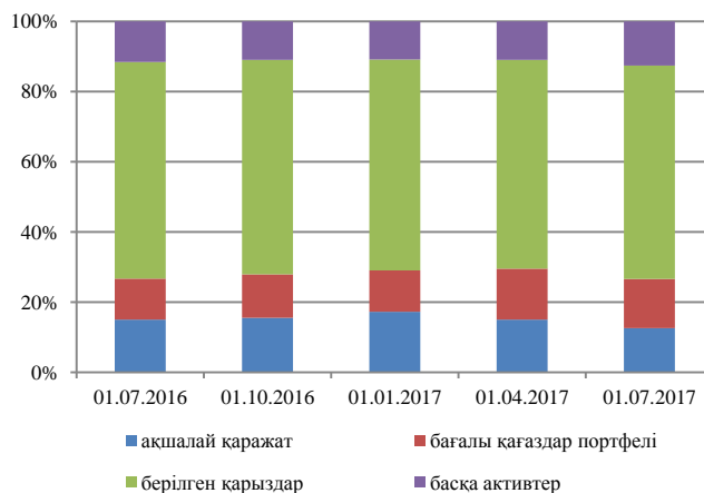
1-график. Банк конгломераттары активтерінің динамикадағы құрылымы