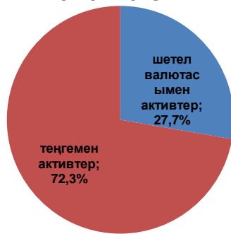
Валюталарға қатысты портфель 01.01.2019ж.