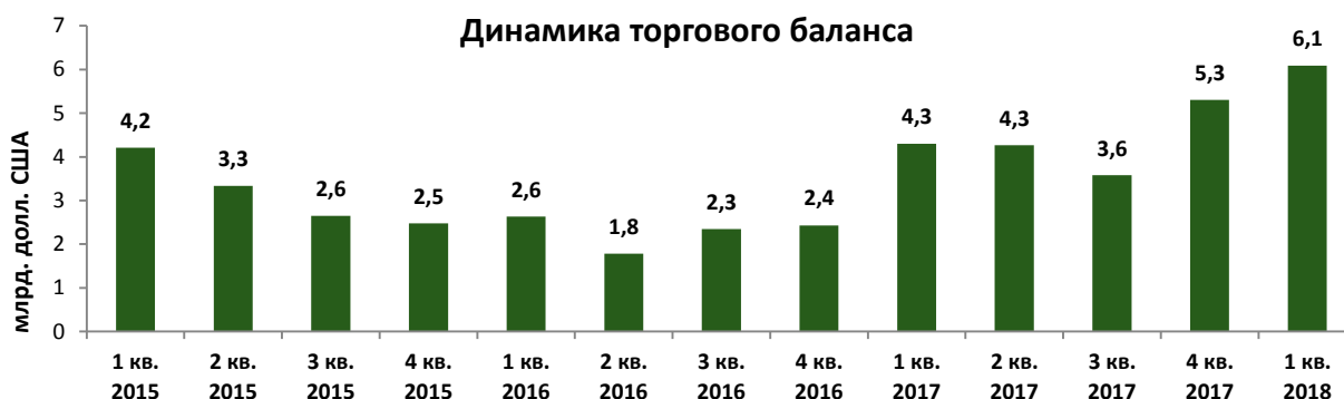
Динамика торгового баланса

Импорт товаров вырос на 15,7% и составил 7,8 млрд. долл. США. Рост импорта произошел по всем группам основной товарной номенклатуры. Наибольшее увеличение (на 24,8%) произошло по ввозу инвестиционных товаров (35,4% от общего импорта). Ввоз товаров промежуточного промышленного потребления увеличился на 9,2%. Импорт потребительских товаров вырос на 13,3%, из них ввоз продовольственных товаров – на 16,1%, непродовольственных товаров – на 11,5%.